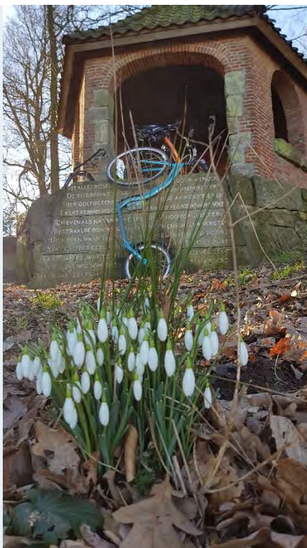
Els van Dijk, Lente 2019

Stuur vooral je mooie stepfoto naar info@toersteppen.nl